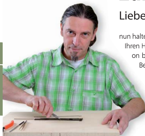
Mario Locker Messe/Kundendienst

nun halten Sie eine neue Ausgabe von „Club aktuell“ in Ihren Händen. Auch dieses Mal hat sich die Redaktion bemüht, das Magazin mit vielen interessanten Beiträgen für Sie lesenswert und informativ zu gestalten. Verschiedene Beiträge der Rubrik „Vorbild & Modell“, technische Informationen, Modell-Details, einen Ausflugstipp im Nationalpark Sächsische Schweiz, der Blick zu unseren Nachbarn nach Österreich... Dies und vieles mehr verspricht kurzweiliges Lesevergnügen.